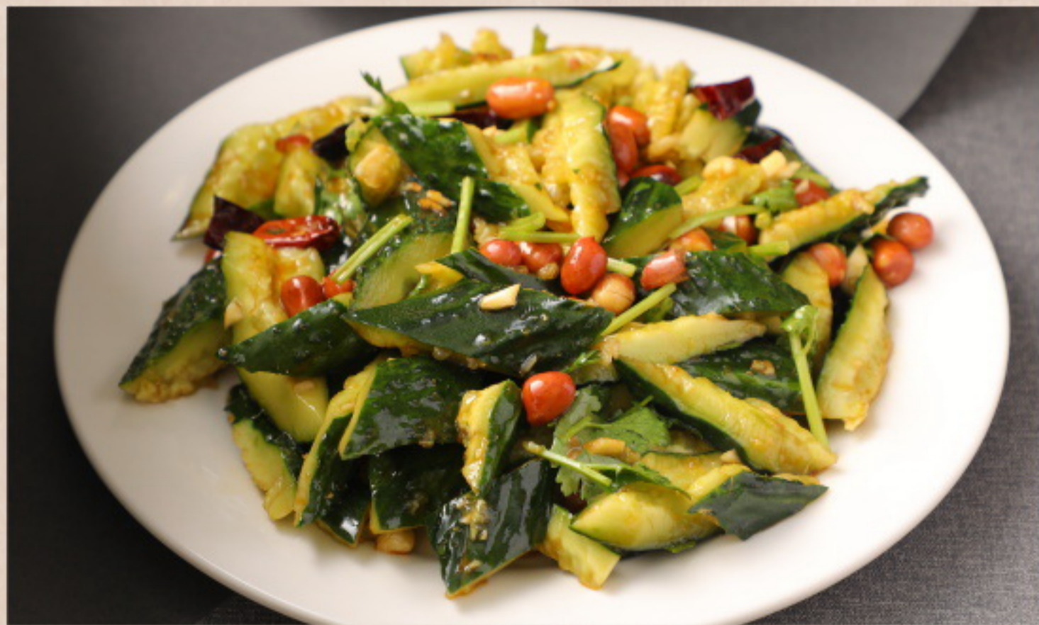
152 拍黄瓜花生米 Salatgurke mit Knoblauch und Erdnussauce