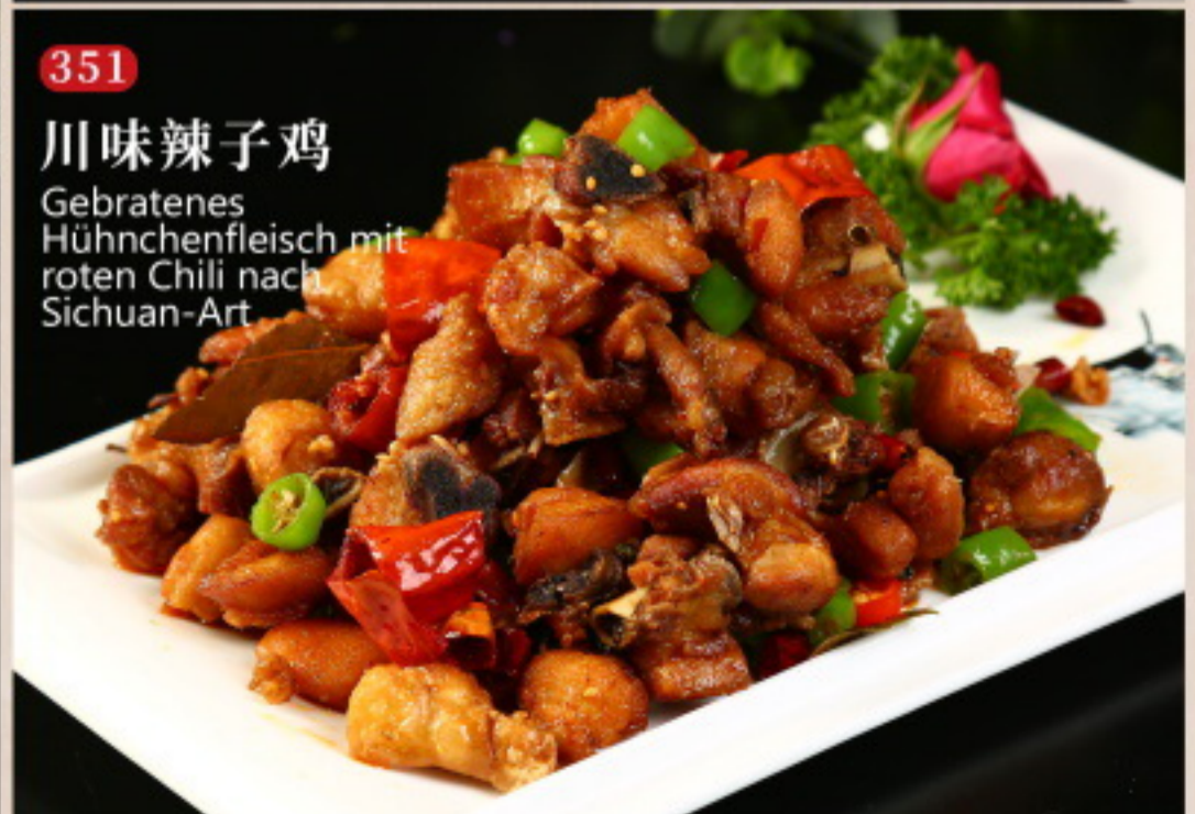
351 川味辣子鸡 Gebratenes Hühnchenfleisch mit roten Chili nach Sichuan-Art