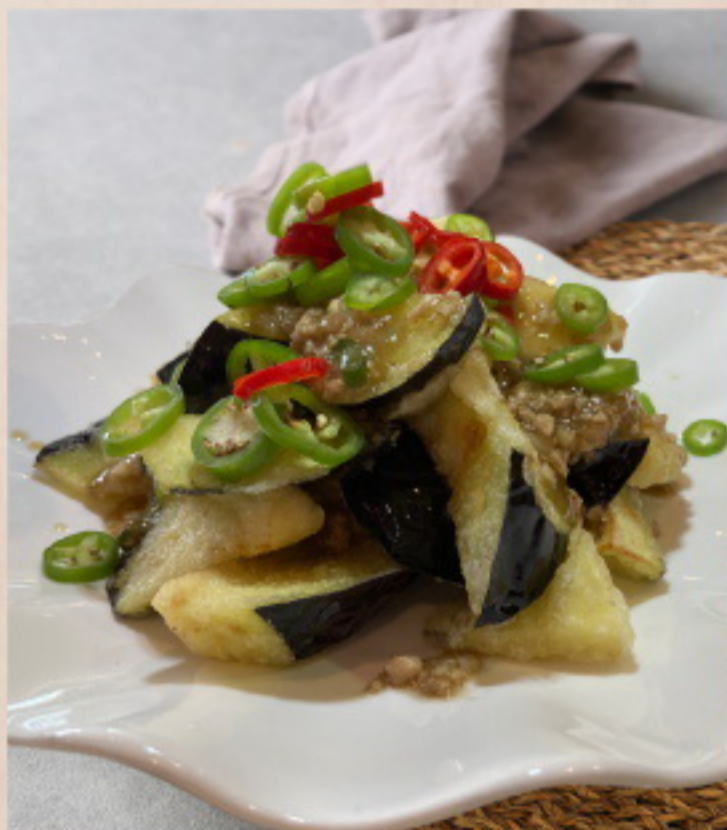
304 肉末茄子 Gebratene Auberginen mi Hackfleisch