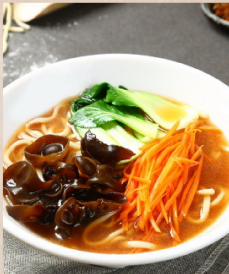
612 什锦汤面 Gemüsesuppe mit Nudeln