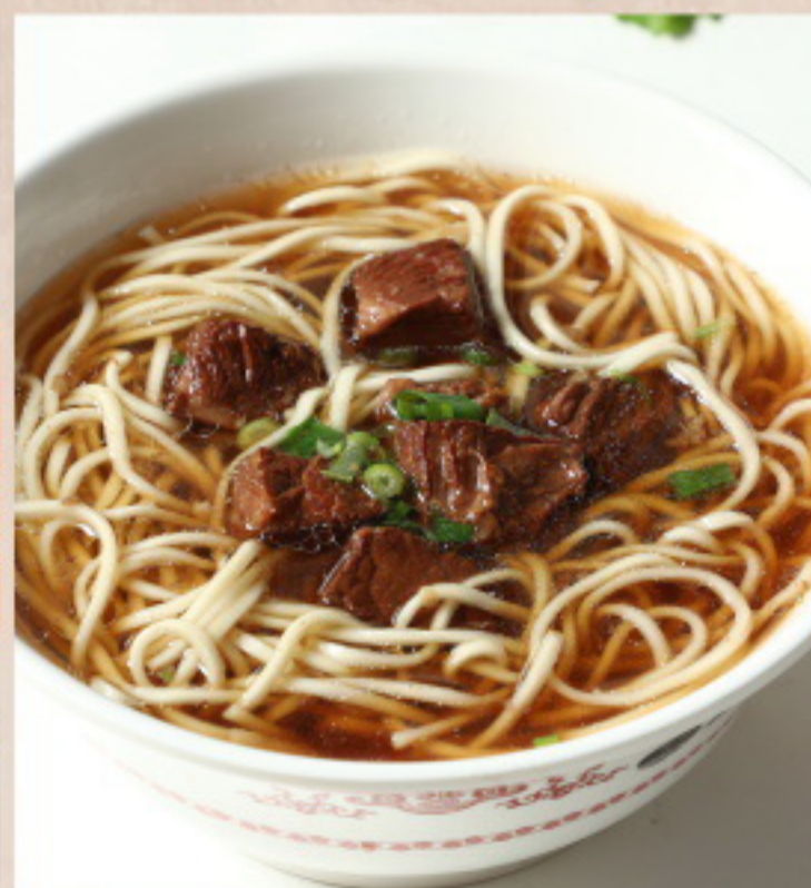
608 红烧牛肉面 Nudelsuppe mit rotgeschmortem Rindfleisch und Gemüse

Bild ist nur als Referenz. 图片仅供参考, 出品以实物为准.