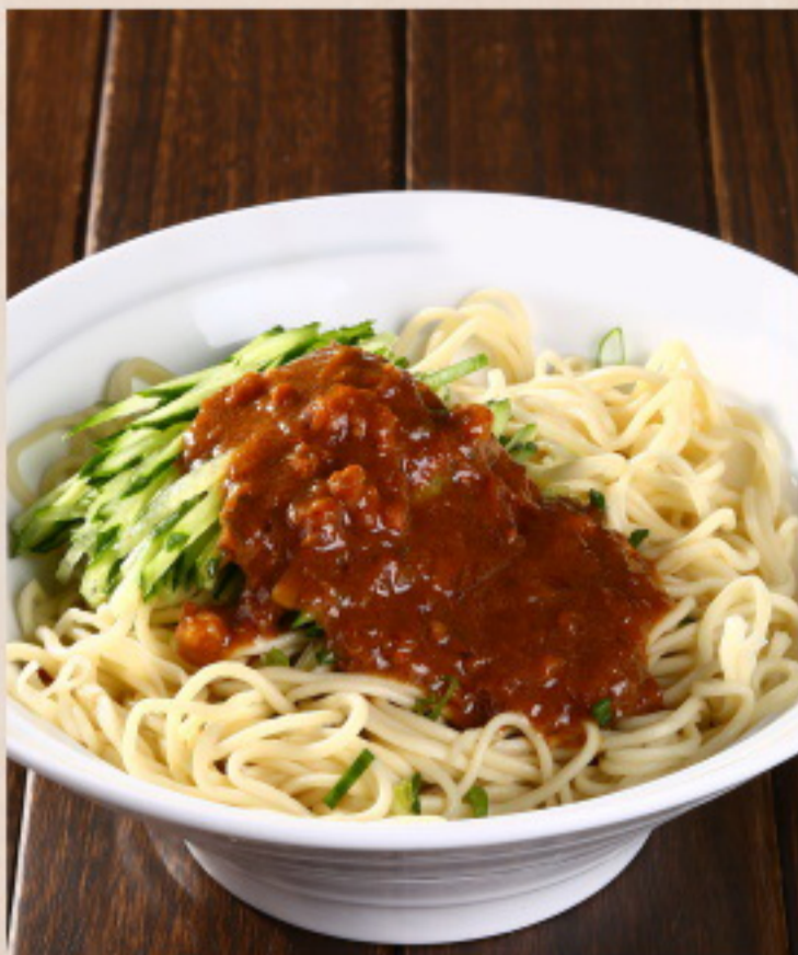
606 老北京炸酱面 Schweinefleisch mit Nudeln in Peking Zhajiang Sauce