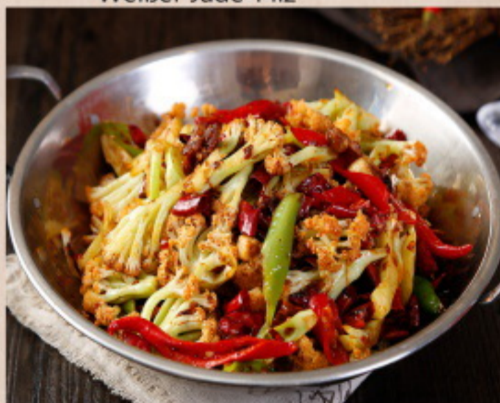
655 干锅花菜 Scharf angebratene Brokkoli