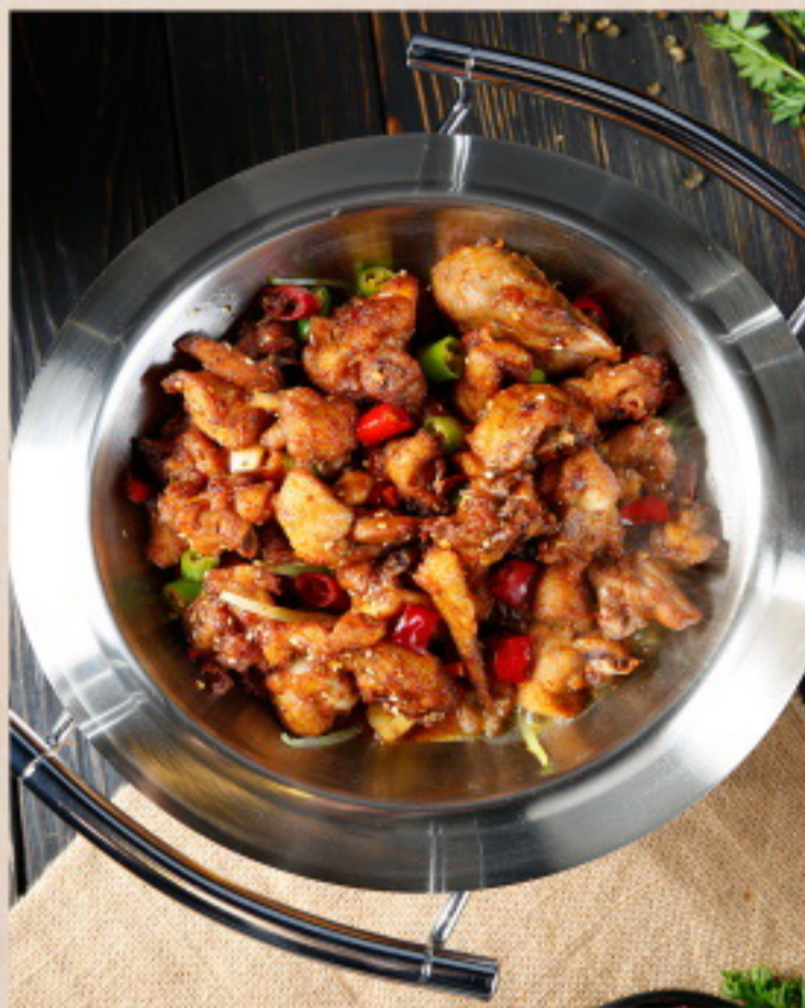
651 干锅鸡 Scharf angebratenes Hühnerfleisch mit verschiedenem Gemüse