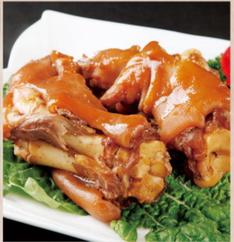
165 酱猪蹄 Gewürzter Schweinefuss