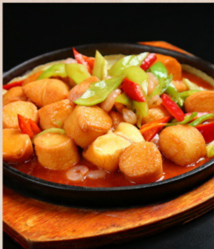
503 铁板日本豆腐 HotCook Japanischer Tofu