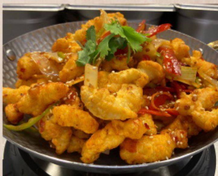
653 干锅白玉菇 Scharf angebratene Weißer Jade-Pilz