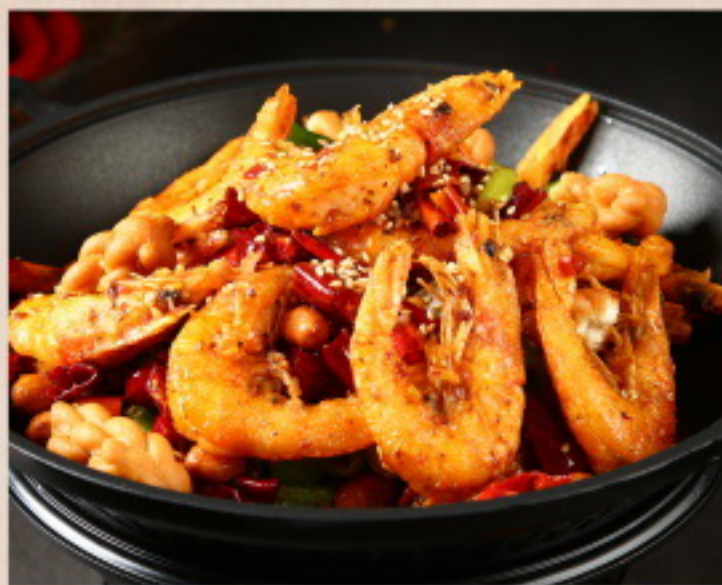
654 干锅虾 Scharf angebratene Garnelen mit Gemüse