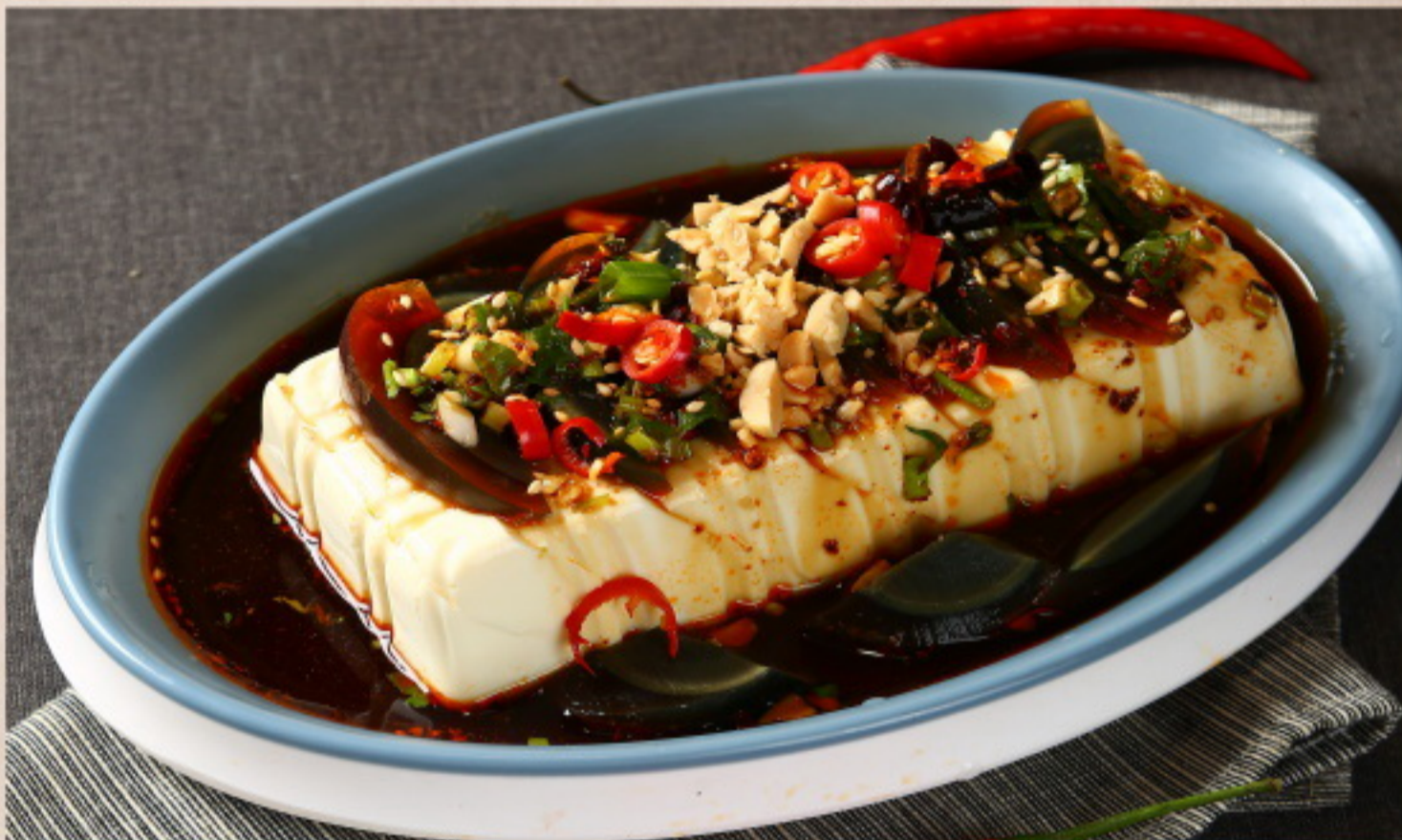
154 皮蛋豆腐 Tausendjährige Eier mit Tofu in Sojasauce