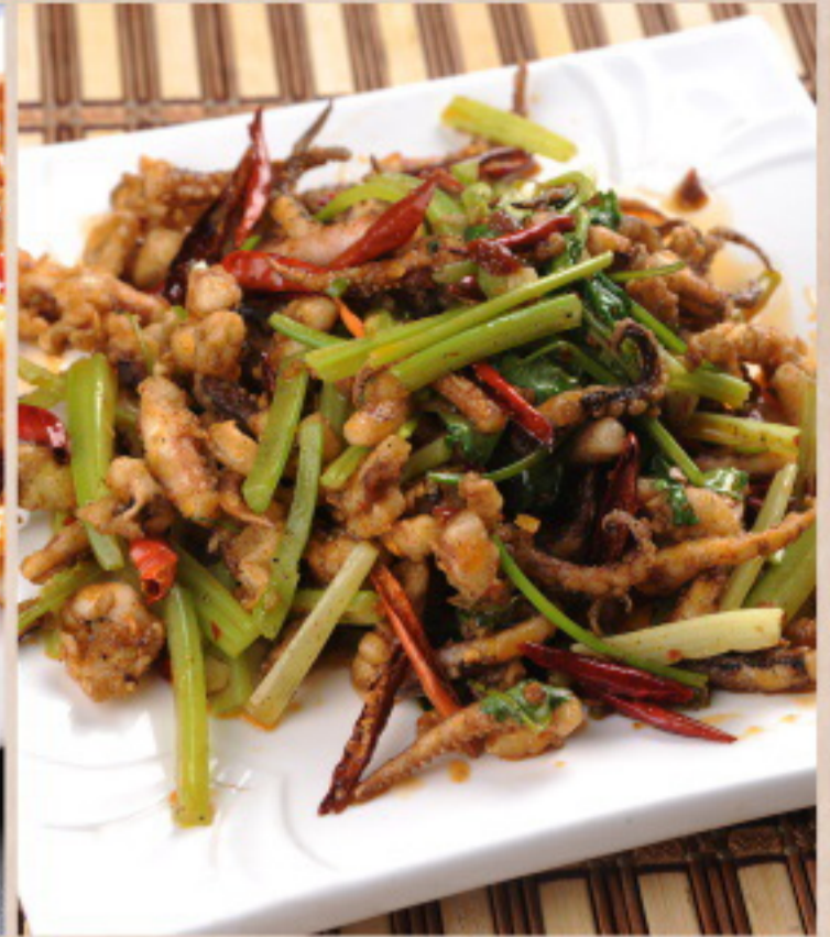
557 干煸鱿鱼须 Scharf angebratene Tentakel. vom Tintenfisch