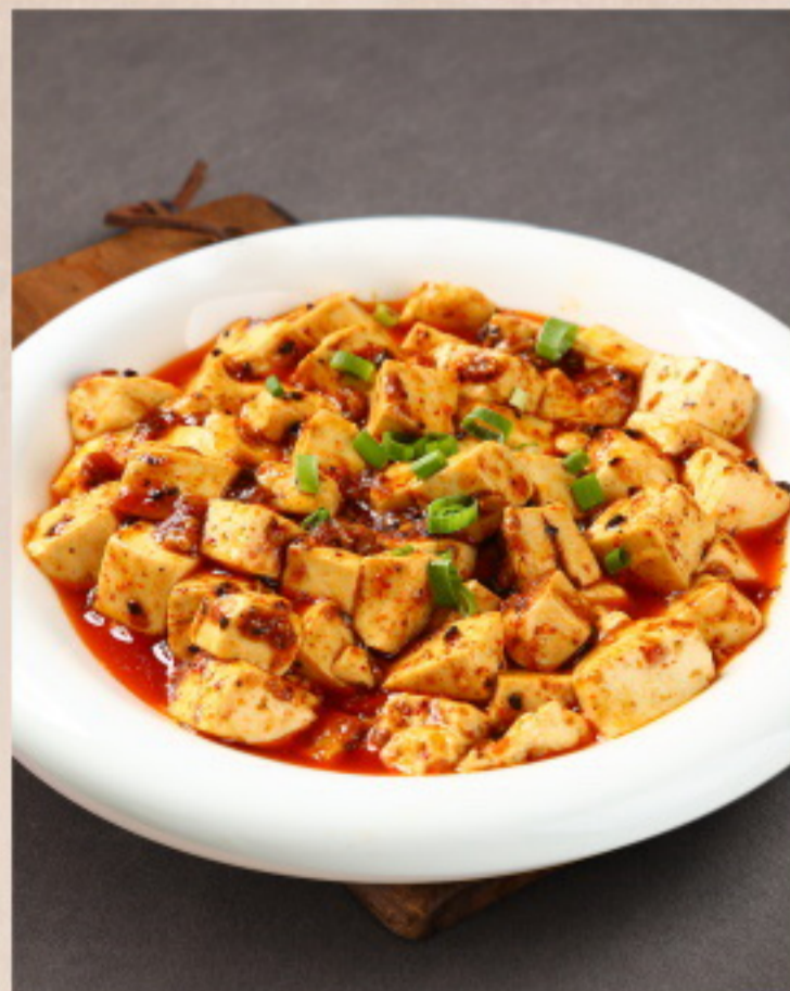
259 麻婆豆腐 Tofu mit Pfeffer und scharfer Sauce mit Hackfleisch