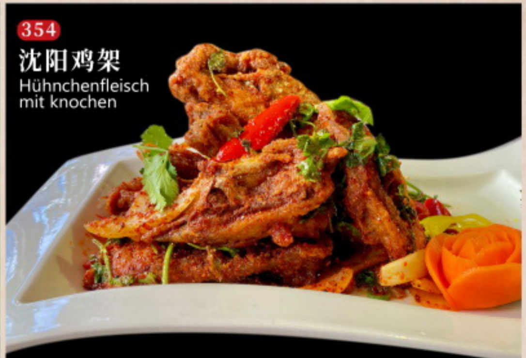
354 沈阳鸡架 Hühnchenfleisch mit Knochen