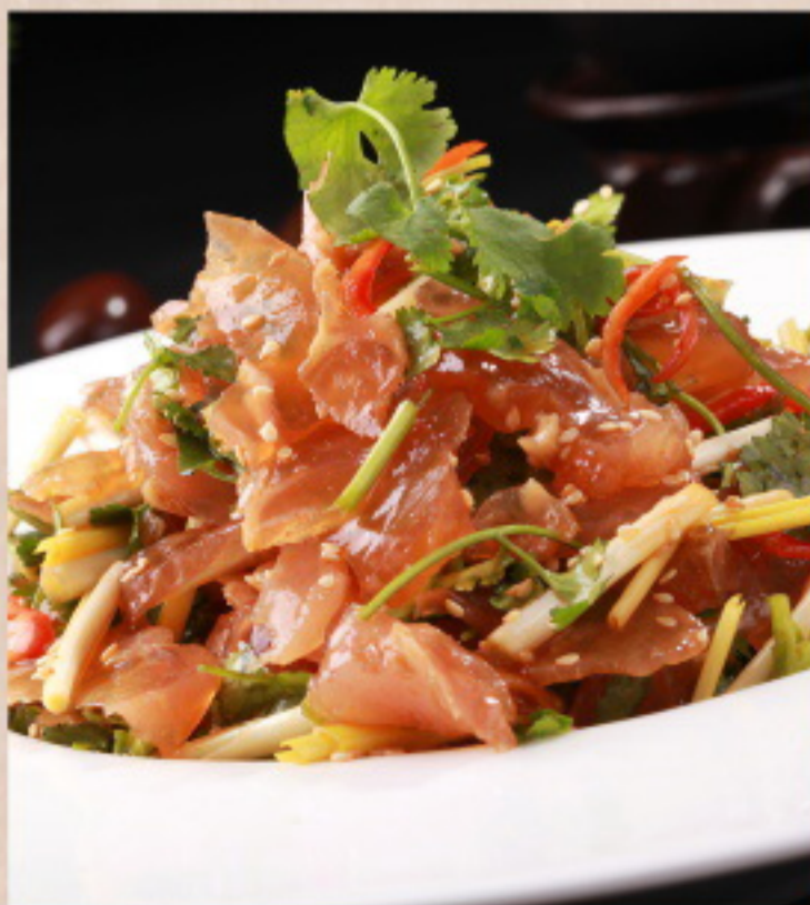
167 凉拌牛筋 Rindersehne