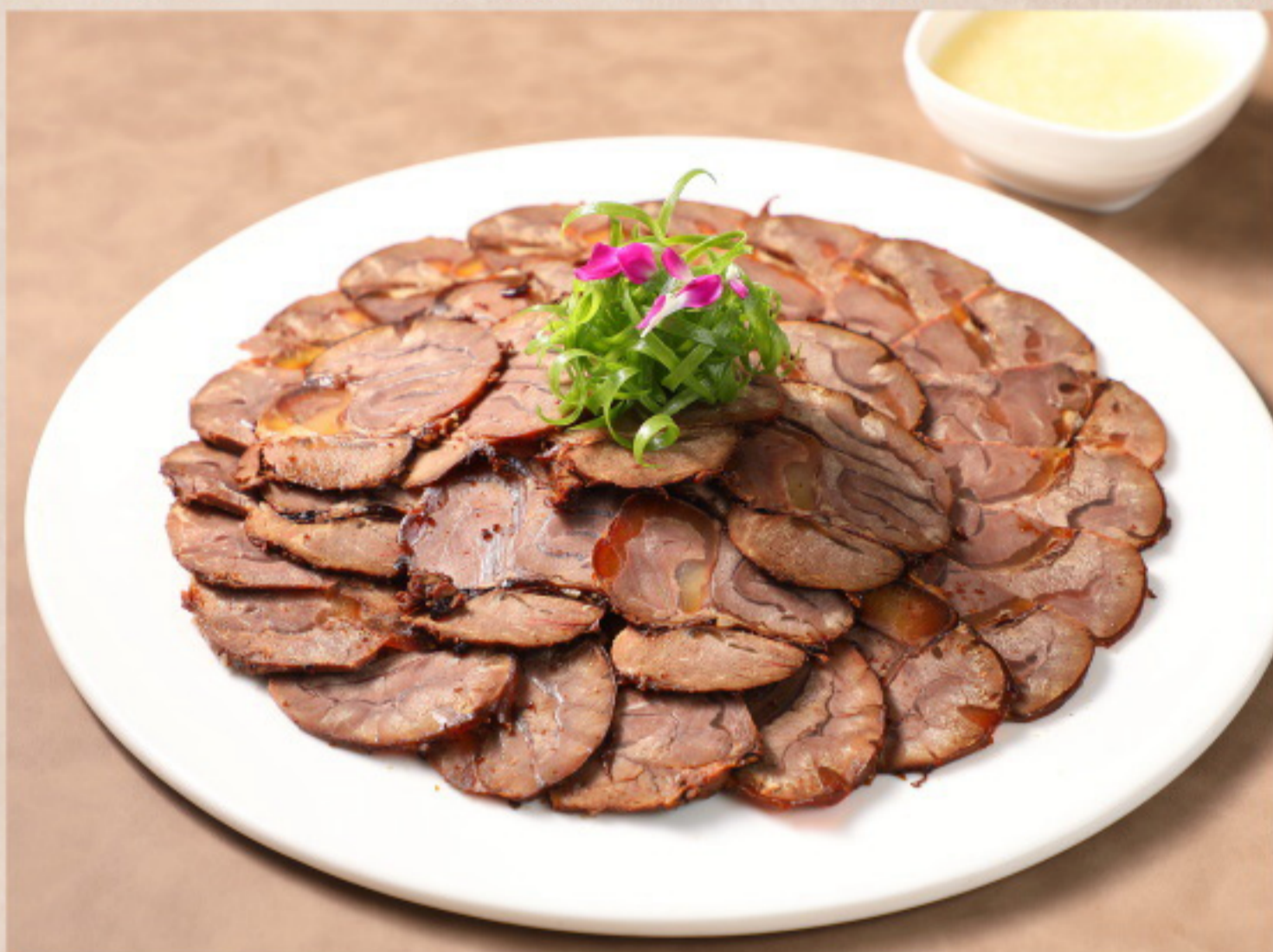
168 腱子肉 Rinderwade