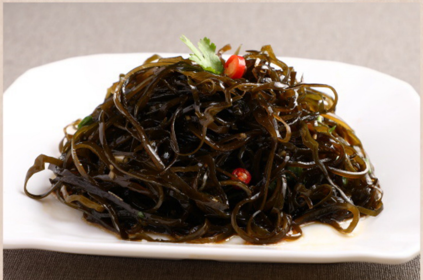
164 凉拌海带丝 seetangsalat