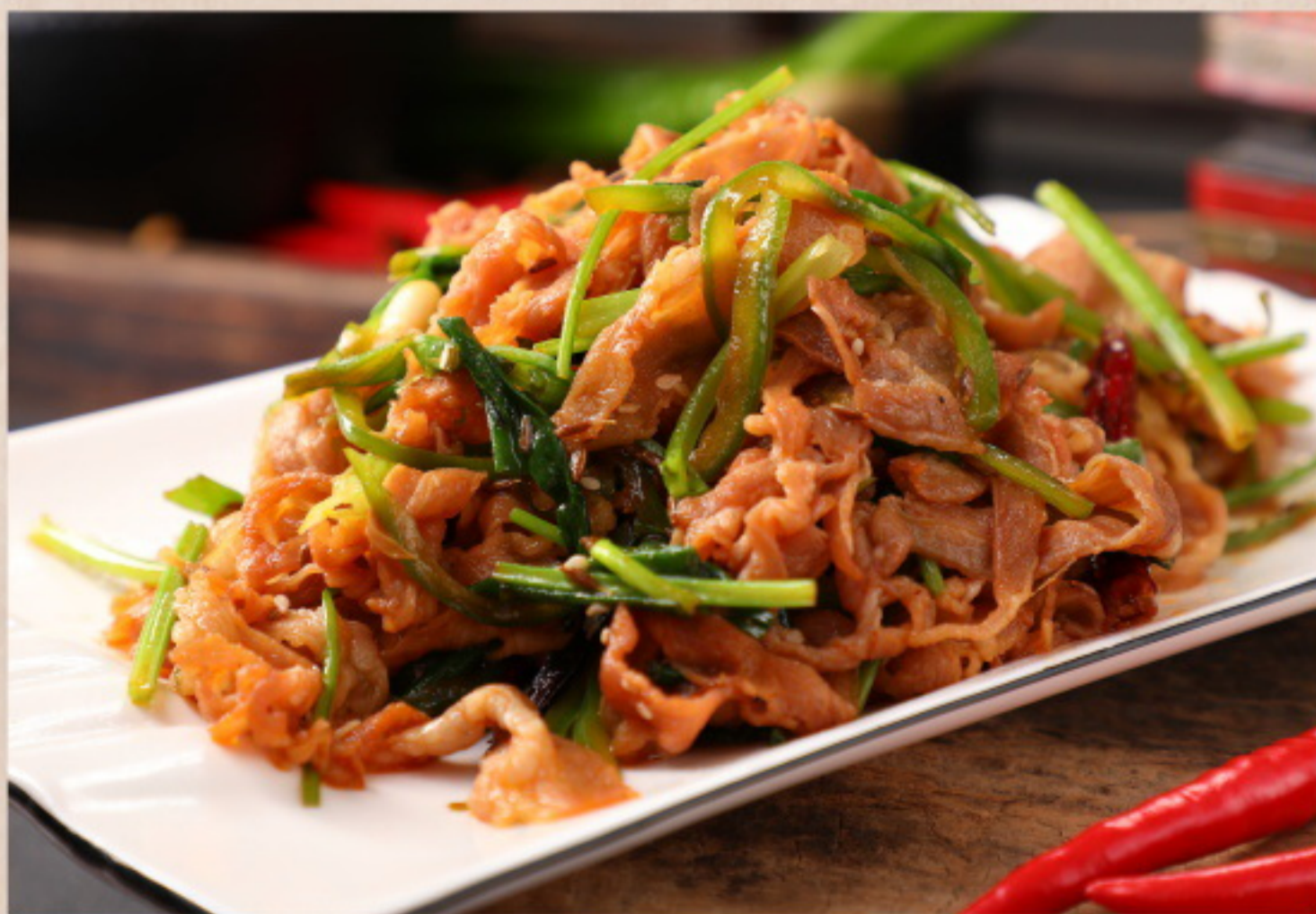
451 孜然羊肉 Gebratenes Lammfleisch mit Kreuzkümmel