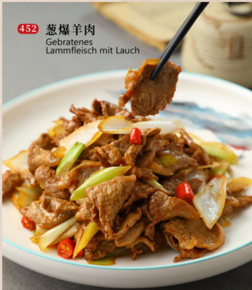
452 葱爆羊肉 Gebratenes Lammfleisch mit Lauch