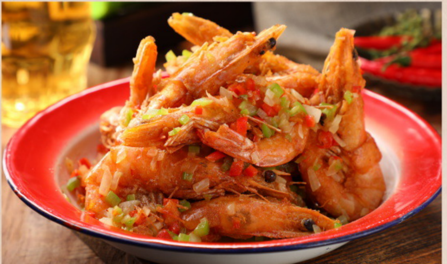
555 椒盐大虾 Gebratene Garnelen mit Knoblauch und Pfeffer