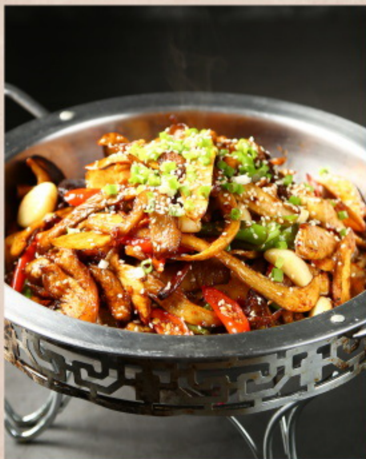
652 干锅肥肠 Scharf angebratener Schweinedickdarm mit verschiedenem Gemüse