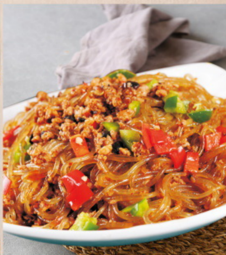
305 蚂蚁上树 Gebratene Glasnudeln mit Hackfleisch