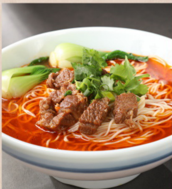
607 香辣牛肉面 Scharfe Nudelsuppe mit Rindfleisch und Pfefferkörnern