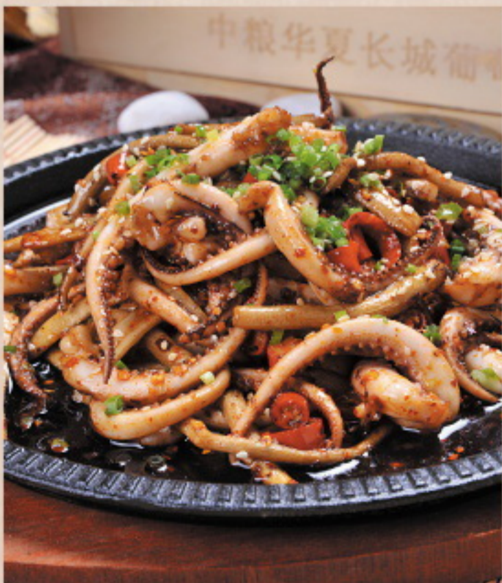
502 铁板鱿鱼须 HotCook vom Tintenfisch