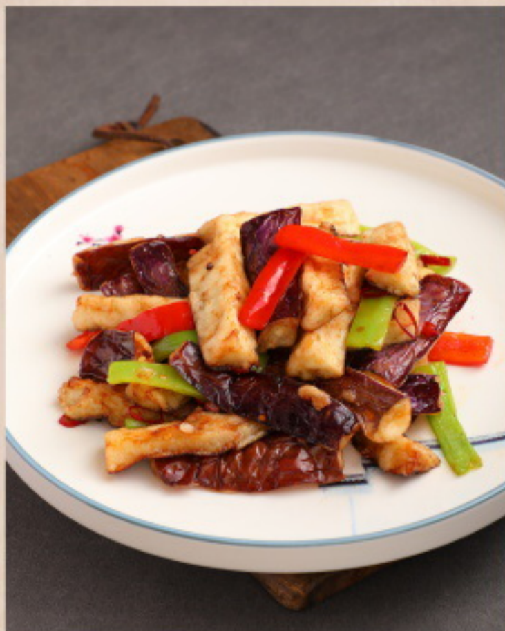
260 鱼香茄子 Gebratene Auberginen Yuxiang-Art