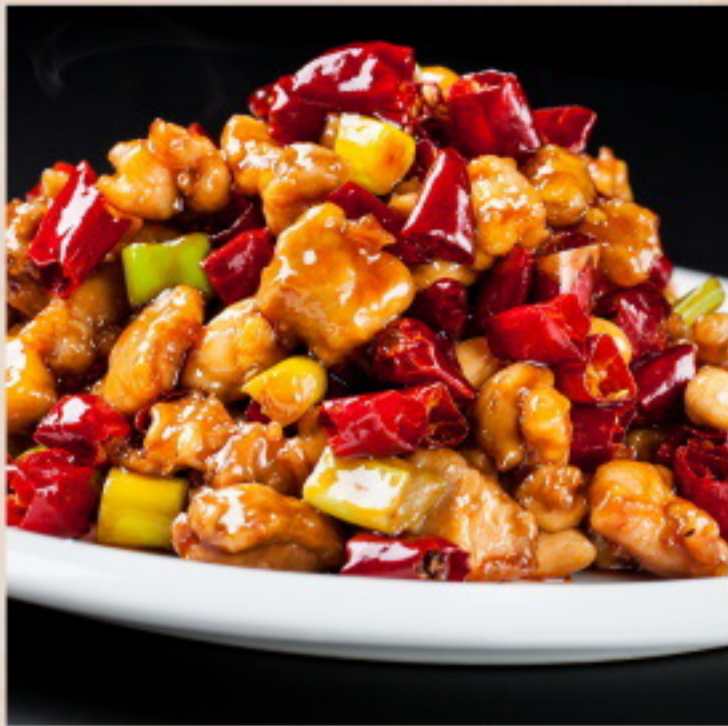
352 宫保鸡丁 Gewürfeltes Huhn mit Erdnüsse nach Kung-Pao-Art