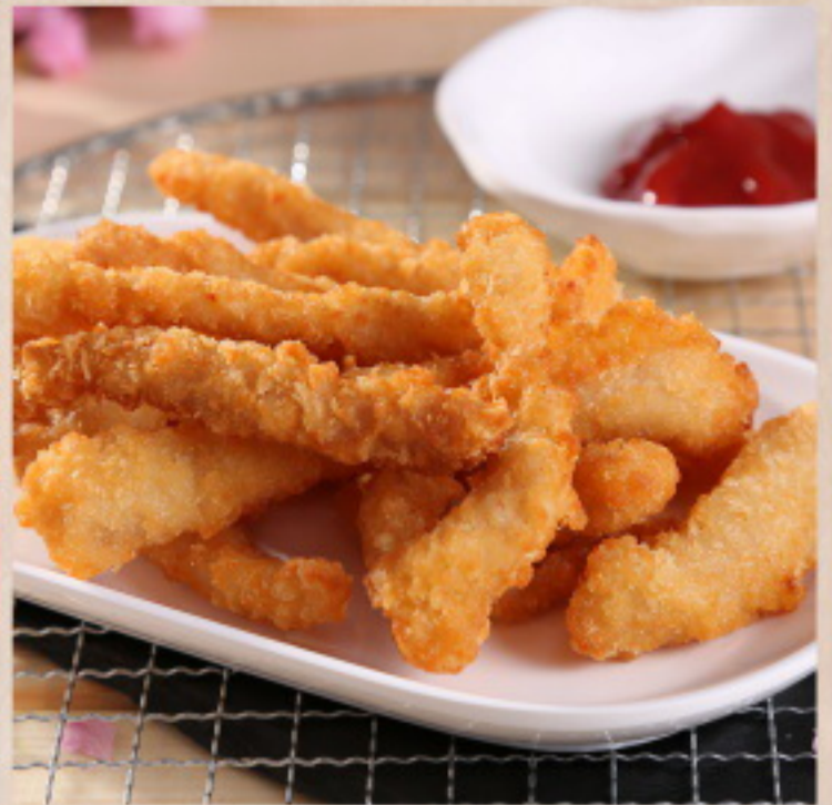
353 黄金鸡柳 Gebratene Chicken-Nuggets