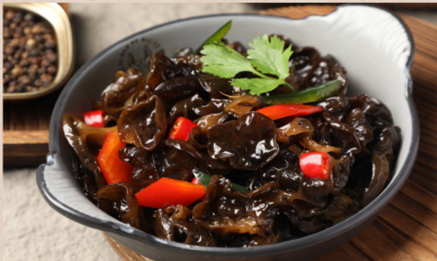
155 爽口木耳 Pilzsalat