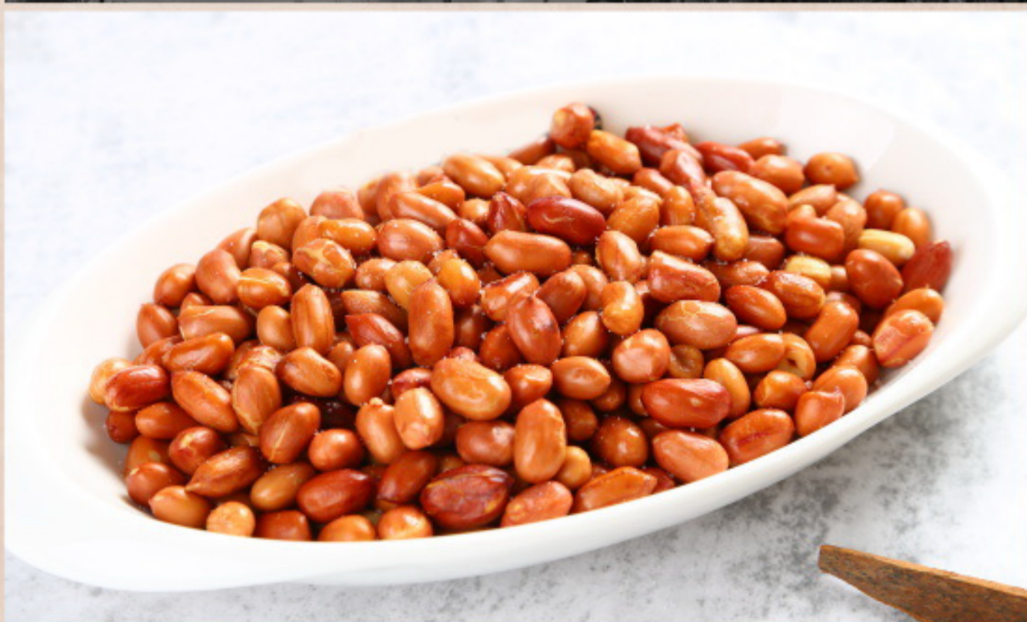
151 油炸花生米 Gebratene Erdnüsse