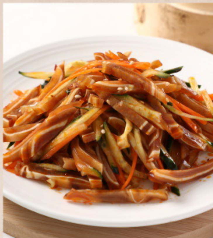
166 红油顺风 Schweineohren