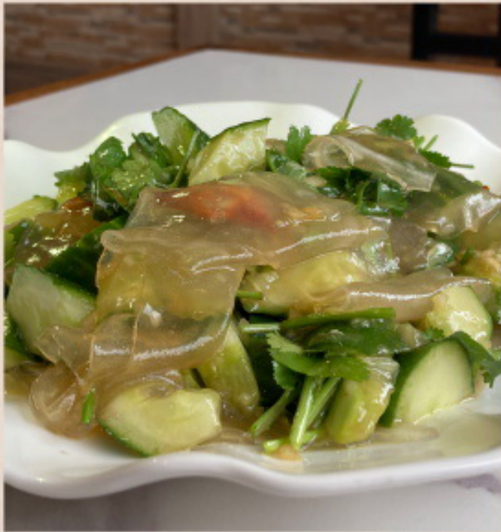
162 东北大拉皮 Nudeln aus Kartoffelmehl mit Gurken