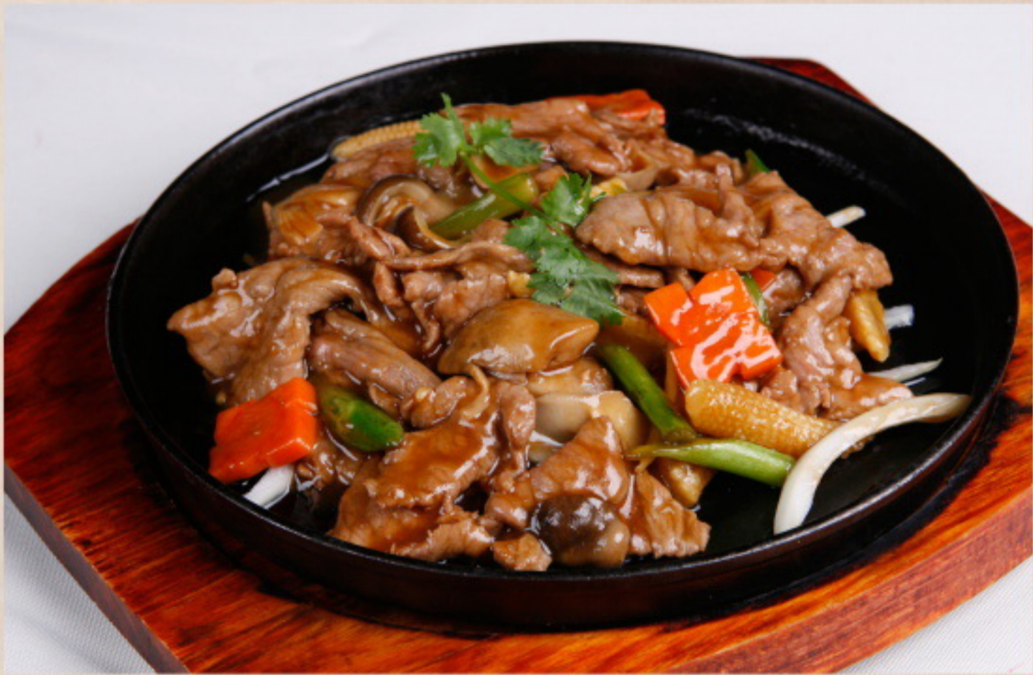
501 铁板牛肉 HotCook Rindfleisch