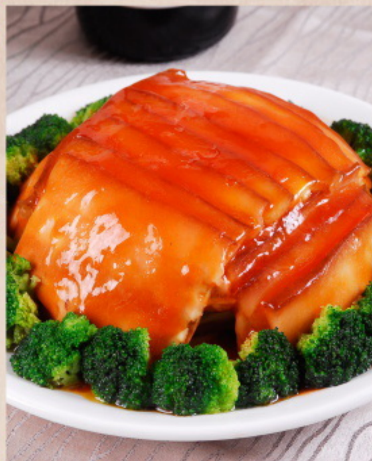
310 梅菜扣肉 Scheiben von geschmortem Schweinebauch mit gesalzenem Gemüse