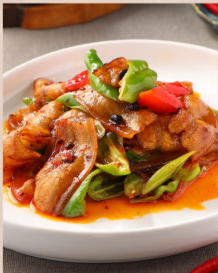
307 回锅肉 Zweimal gebratener Schweinebauch mit Lauchzwiebeln