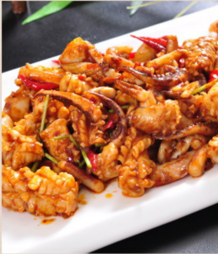
556 爆炒鱿鱼 Gebratener Tintenfisch